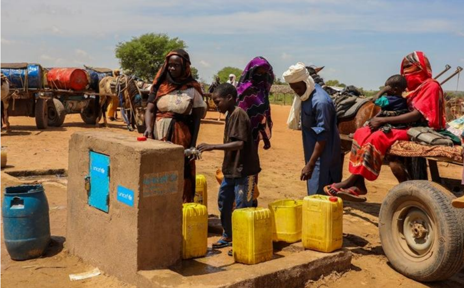
Neuankommende sudanesishe Flüchtlinge erreichen den von UNICEF eingerichteten Wasserpunkt in Adré im Osten des Tschad, nahe der sudanesischen Grenze.

Im Osten des Tschad leben Hunderttausende geflüchtete Kinder unter schwierigsten Bedingungen. Sie haben Gewalt erlebt, sind mangelernährt und haben kaum Zugang zu sauberem Wasser, medizinischer Versorgung oder Bildung. Die Situation ist dramatisch – nicht nur für Geflüchtete aus dem Sudan, sondern auch für zurückgekehrte tschadische Familien und die aufnehmende Bevölkerung. UNICEF setzt sich im Rahmen der «Sternenwochen» 2025 dafür ein, dass diese Kinder Schutz, Hilfe und neue Hoffnung erhalten – unabhängig davon, woher sie kommen.