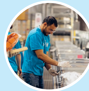
1. Lagern und Verpacken