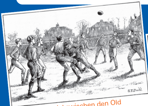
Ein Fussballspiel zwischen den Old Etonians und den Blackburn Rovers in den frühen 1870er-Jahren.

Ballspiele mit Kicken existieren seit über 2000 Jahren. Der moderne Fussball mit festen Regeln entstand in England im 19. Jahrhundert. Auf den Britischen Inseln wurde schon seit dem 15. Jahrhundert Fussball gespielt: Damals versuchten zwei Dörfer, einen Ball in das gegnerische Stadttor zu befördern. Das «Spielfeld» lag immer zwischen zwei Dörfern, selbst wenn diese mehrere Kilometer auseinander lagen. Dabei war alles erlaubt, schlimme Verletzungen kamen häufig vor, weshalb diese äusserst brutalen Spiele verboten wurden. Später wurden sie an Schulen und Universitäten als Sportart eingeführt. 1863 entstand in London der erste Verband, die «Football Association» (FA).