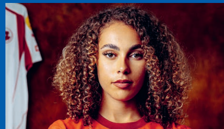
Alayah Pilgrim Fussballerin Schweizer Nationalmannschaft