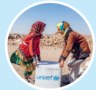
3. Hilfe kommt an

So funktioniert die UNICEF Nothilfe: Stell dir vor, du müsstest von einem Tag auf den anderen ungeschützt draussen im Freien leben. Weltweit erleben dies jeden Tag Tausende Kinder. Erdbeben, Wirbelstürme, Überschwemmungen oder Kriege führen dazu, dass viele Familien ganz plötzlich vor dem Nichts stehen. Vor allem für Kinder sind solche Situationen beängstigend und oft lebensbedrohend. Jetzt zählt jede Stunde. Es braucht so schnell wie möglich sauberes Trinkwasser und Schutzplanen, Kleider, Decken, Essen, Hygieneartikel, Medikamente, Impfungen und noch viele andere Dinge. Damit UNICEF sofort