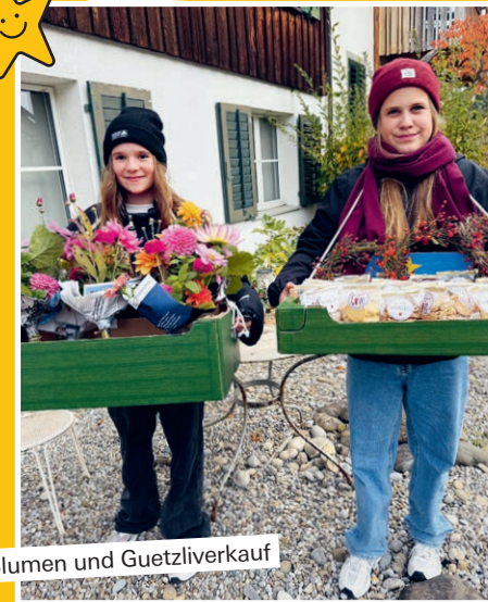
Blumen und Guetzliverkauf