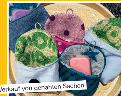
Verkauf von genähten Sachen