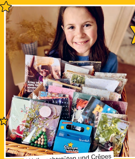
Weihnachtstüten und Crêpes

78 700 Kinder erhielten Lern- und Schulmaterial.