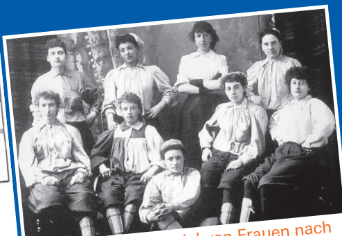
Das erste Fussballspiel von Frauen nach den offiziellen Regeln der «Football Association» fand 1881 in Edinburgh statt.

Bild Beckham: © UNICEF/UN16866 | Siegfried Meobis. Bild Messi: © UNICEF/UN169410 | Susan Markisz