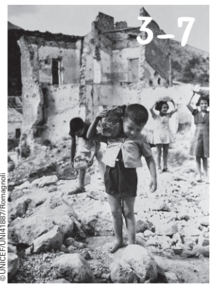
80 Jahre UNICEF