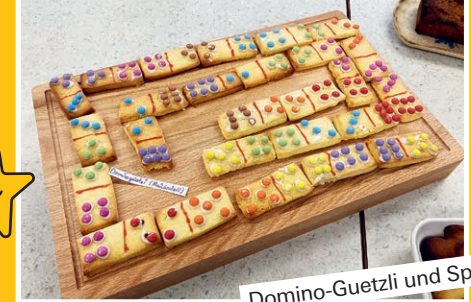
Domino-Guetzli und Spiele