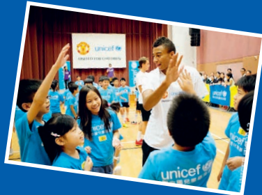
© Manchester United Foundation / United for UNICEF – Messi: © Josp. Lago