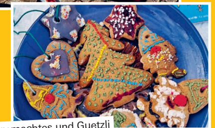
Selbstgemachtes und Guetzli