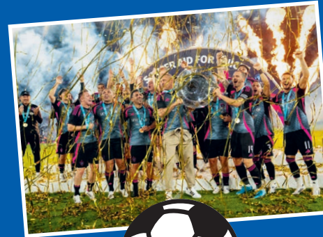
Soccer Aid: © UNICEF/UK