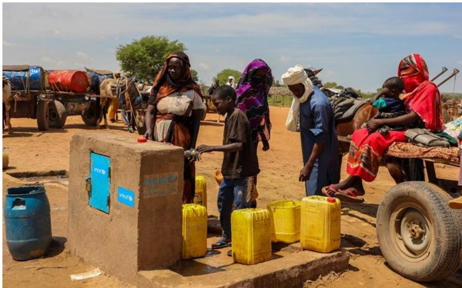
Des réfugiés soudanais nouvellement arrivés atteignent le point d'eau installé par l'UNICEF à Adré, à l'est du Tchad, près de la frontière soudanaise.

À l'est du Tchad, des milliers d'enfants réfugiés vivent dans des conditions très difficiles. Ils ont connu la violence, souffrent de malnutrition et n'ont guère accès à de l'eau propre, à des soins médicaux ou à une formation scolaire. La situation est dramatique – pas seulement pour les réfugiés du Soudan mais aussi pour les familles tchadiennes de retour et pour la population d'accueil. À l'occasion des «Semaines des étoiles» 2025, l'UNICEF s'emploie à ce que ces enfants trouvent une protection, de l'aide et un nouvel espoir – quelles que soient leurs origines.